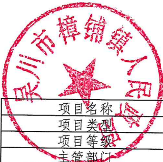
项目支出绩效目标表