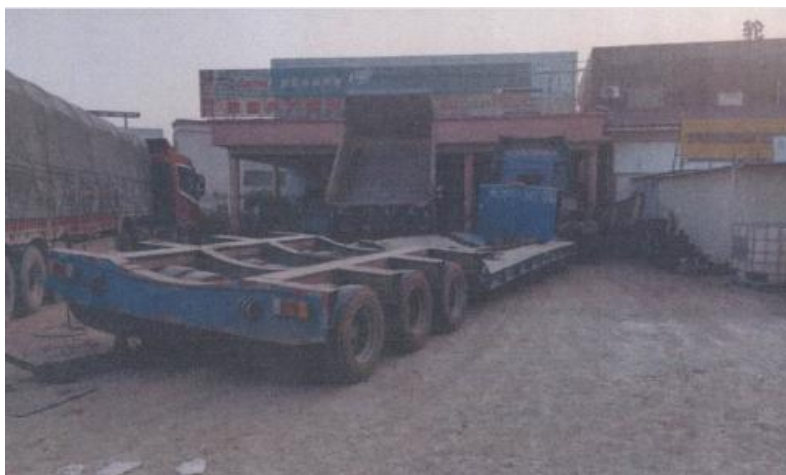
图 2 事故现场图

事故发生在吴川市黄坡镇 G228 国道旁的刘 X 兵汽修厂室外维修作业区域。重型牵引货车（辽 XXXX85）车头朝南，停放在刘 X 兵汽修厂室外维修作业区域，停放区域地面平整无坡度。