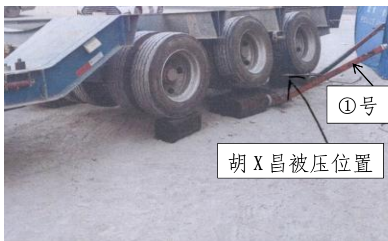
图 3 事故位置情况图

重型牵引货车（辽 XXXX85）驾驶室内挡位未调为驻车挡，挡位状态为前进 1 挡，且驻车制动系统（手刹）未处于拉紧状态，钥匙插在钥匙孔上。