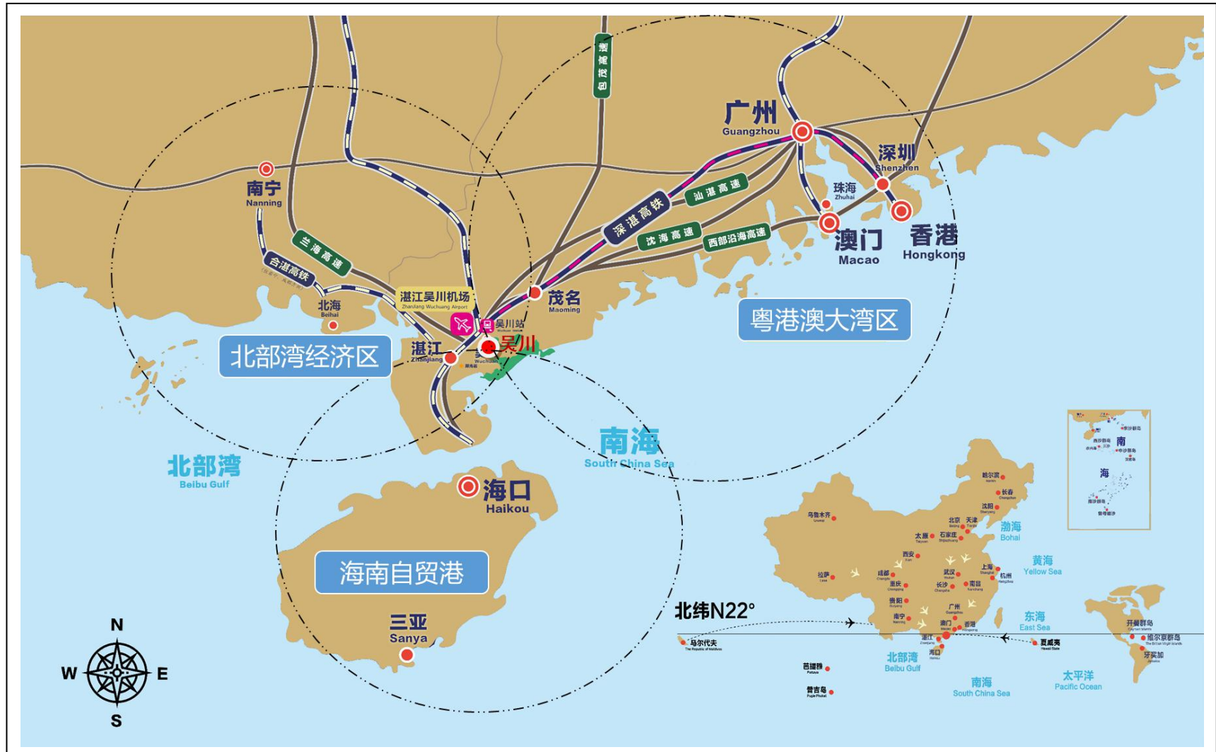
图 1 吴川市区位图