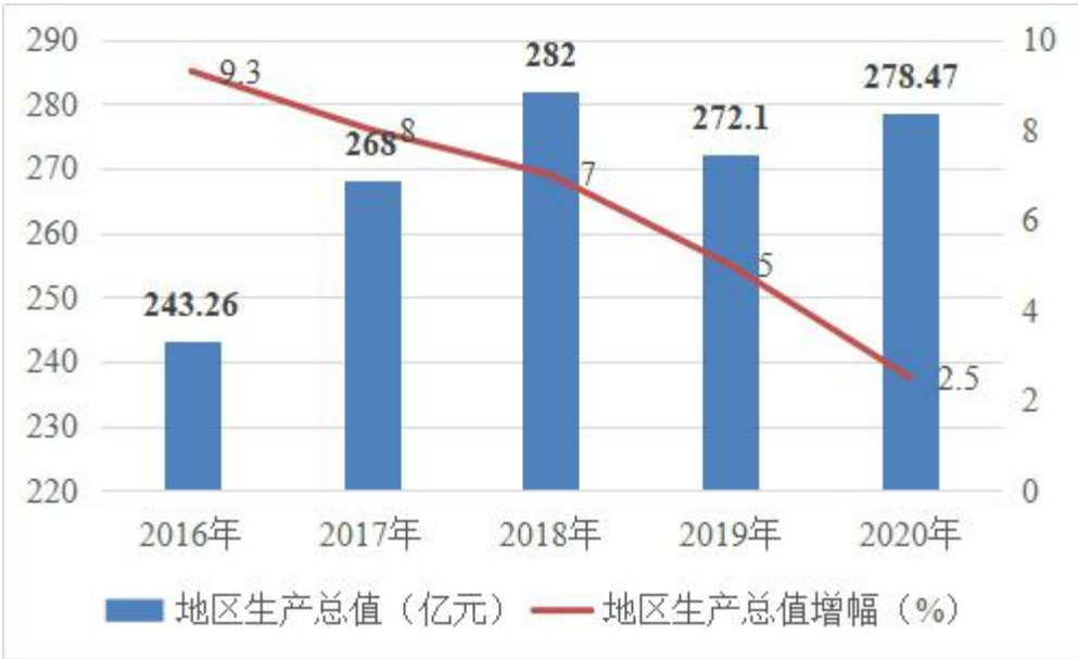
图2 “十三五”时期吴川市生产总值

坚持量质提升,经济综合实力稳步增强。全市生产总值由2015年的205.65亿元上升至2020年的278.47亿元,年均增长6.3%;人均生产总值由2015年的2.14万元上升至2020年的2.47万元,年均增长2.9%;投资保持稳定,“十三五”期间累计完成固定资产投资916.71亿元,年均增长8.7%。全市财政收入持续向好,地方一般公共预算收入由2015年的6.9亿元上升至2020年的11.16亿元,年均增长10.1%;市场保持繁荣,社会消费品零售总额由2015年的99.57亿元上升至2020年的147.98亿元,年均增长7.8%;外贸运行保持稳定,外贸进出口总额由2015年的8.47亿元上升至2020年的11.01亿元,年均增长5.4%;实际利用外资累计2293万美元,年均增长31.1%,提前一年完成“十三五”预期目标。