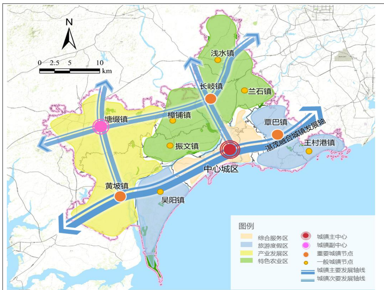
图 5 城乡空间布局图